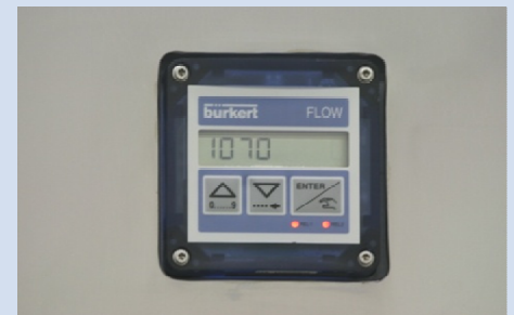
Vorwählzähler für Füllmenge

Leistung: 3 Liter bis 240 Beutel/Stunde 5 Liter bis 200 Beutel/Stunde 10 Liter bis 120 Beutel/Stunde